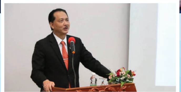
Pelancaran Garis Panduan Klinik (CPG)