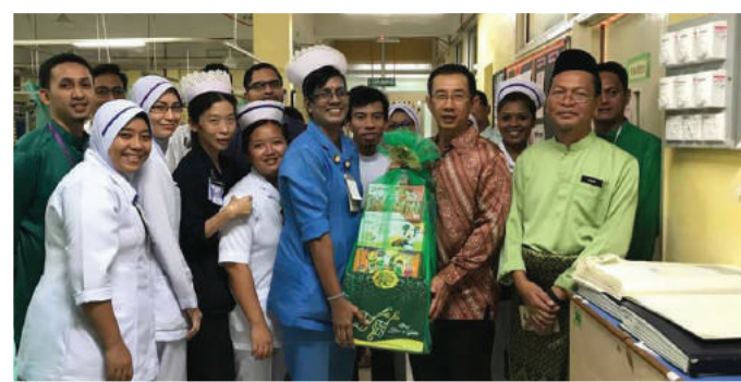
Lawatan ke Hospital Kajang sempena sambutan Hari Raya Aidilfitri