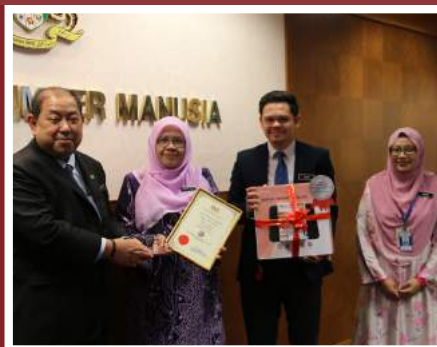
Tempat Kedua Zon Latihan