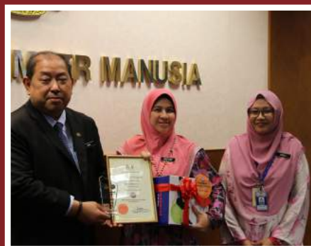
Tempat Kelima Zon Kesihatan