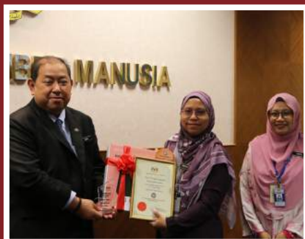
Tempat Keempat Zon Keselamatan