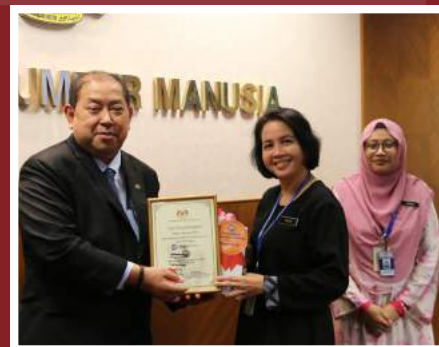
Tempat Ketiga Zon Sains Kesihatan Bersekutu