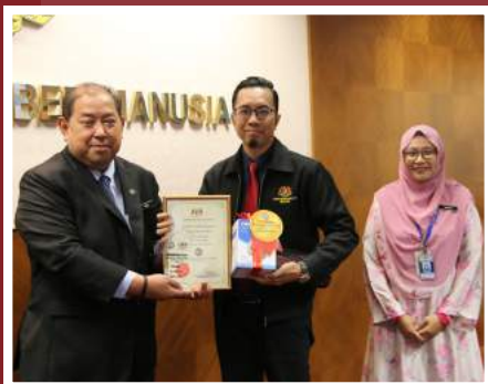
Tempat Pertama Zon Farmasi