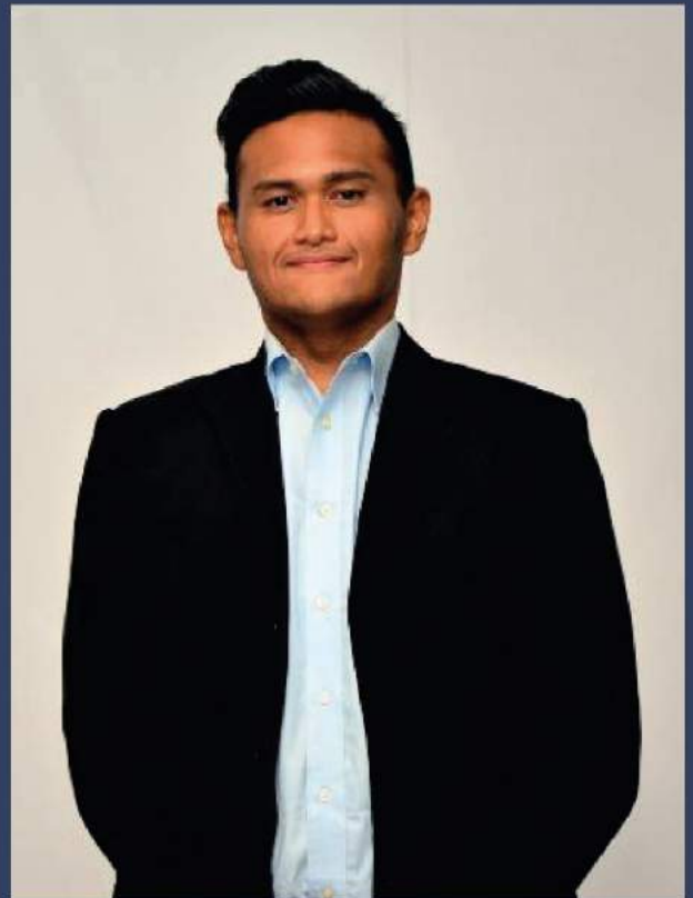
Berat selepas: 95 kg