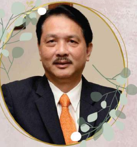
Datuk Dr. Noor Hisham Abdullah KETUA PENGARAH KESIHATAN Kementerian Kesihatan Malaysia