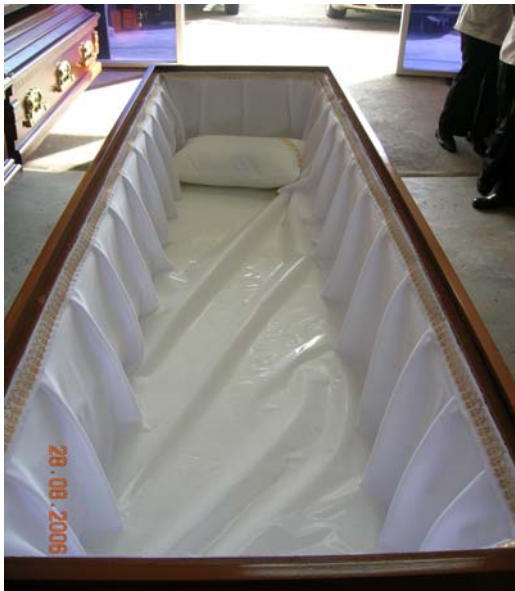
Keranda yang dilapiskan plastik digunakan untuk mayat berpenyakit

C. Jika berlaku sesuatu kemalangan pastikan keranda berada dalam keadaan baik, jika berlaku kerosakkan pastikan langkah-langkah keselamatan(PPE, Dekontaminasi) dilakukan untuk mengelakkan jangkitan penyakit berjangkit.