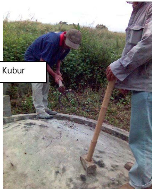
Pengalihan Semula Kubur