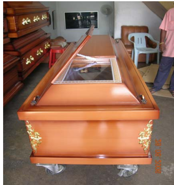
Keranda dengan pembukaan untuk memudahkan mayat dilihat dari luar