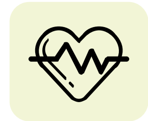
Ketua Pegawai Farmasi Institusi KKM - Jabatan Farmasi, HKL - Jabatan Farmasi, IKN