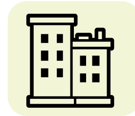
Timbalan Pengarah Kesihatan Negeri (Farmasi) (TPKN(F)) Bahagian Perkhidmatan Farmasi, JKN