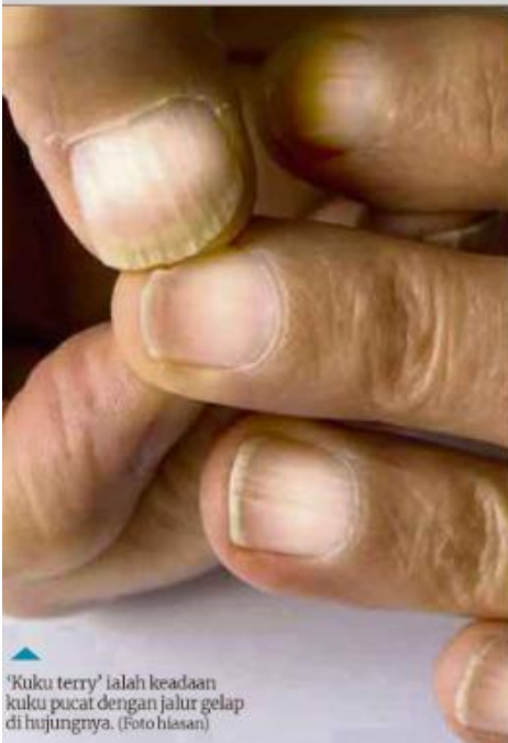
'Kuku terry' ialah keadaan kuku pucat dengan jalur gelap di hujungnya. (Foto hiasan)

Kuku bukan sekadar pelindung jari, ia boleh mendedahkan banyak mengenai kesihatan tubuh.