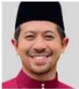
Pakar Pergigian Pra Warta (Kesihatan Awam) Pusat Pakar Pergigian Sabah