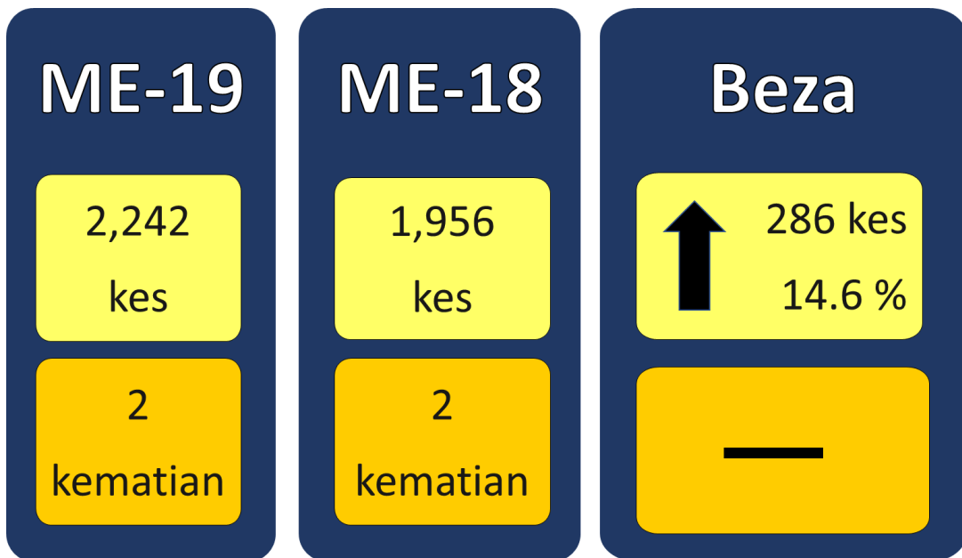
Gambarajah 1: Perbandingan kes dan kematian demam denggi minggu ke-19 dan ke-18 tahun 2023