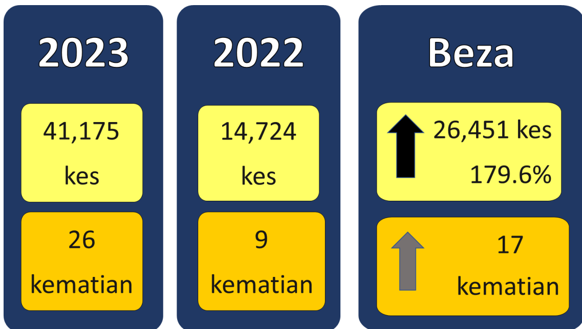
Gambarajah 2: Perbandingan kes dan kematian demam denggi sehingga minggu ke-19 tahun 2023 dan tempoh sama tahun 2022