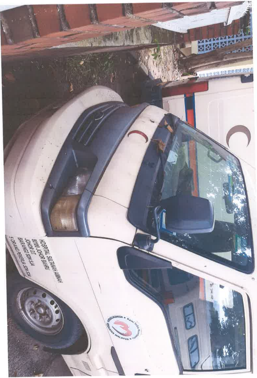
Pandangan Hadapan Kenderaan