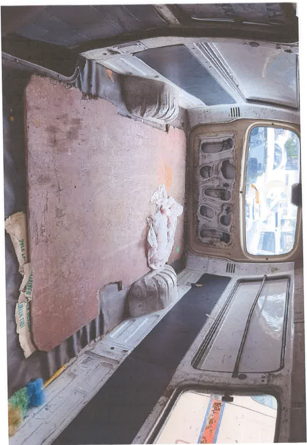
Pandangan Dalam - Bahagian Dalam Belakang