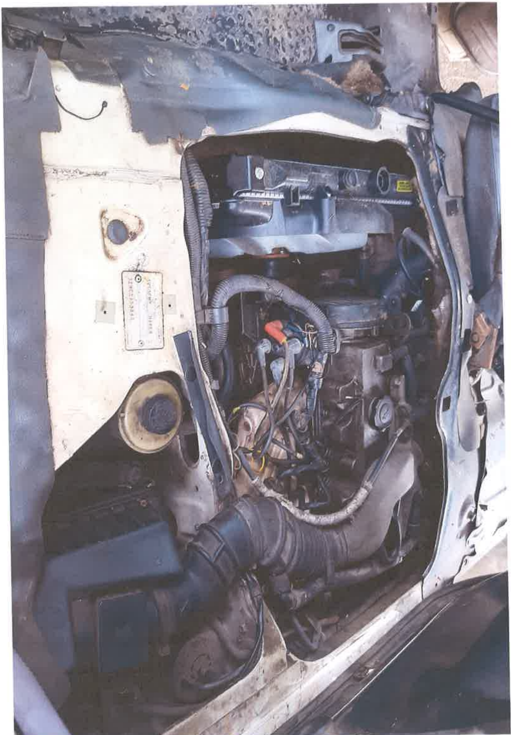
Pandangan Dalam - Bahagian Enjin Kenderaan