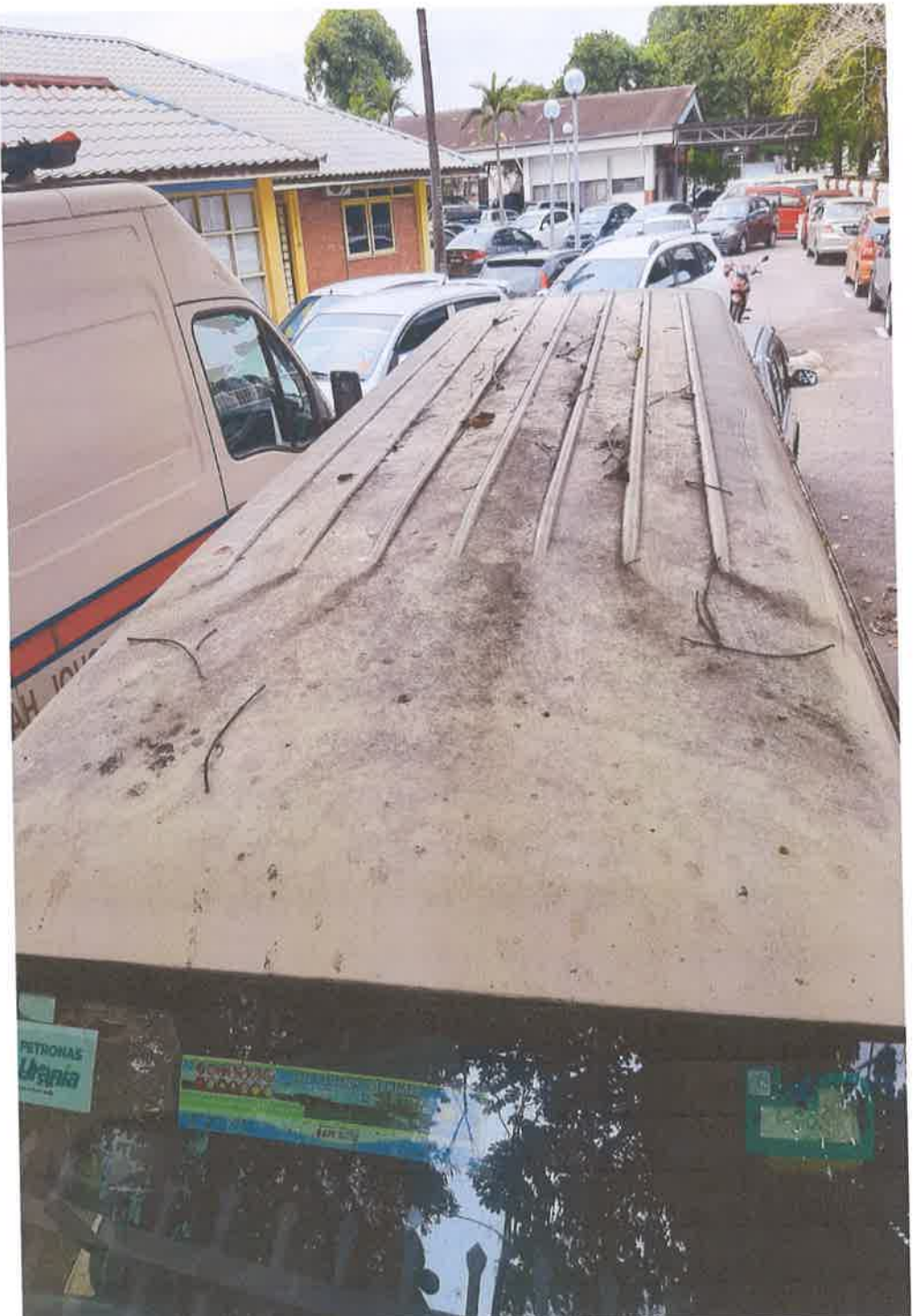
Pandangan Atas- Bahagian Bumbung Kenderaan