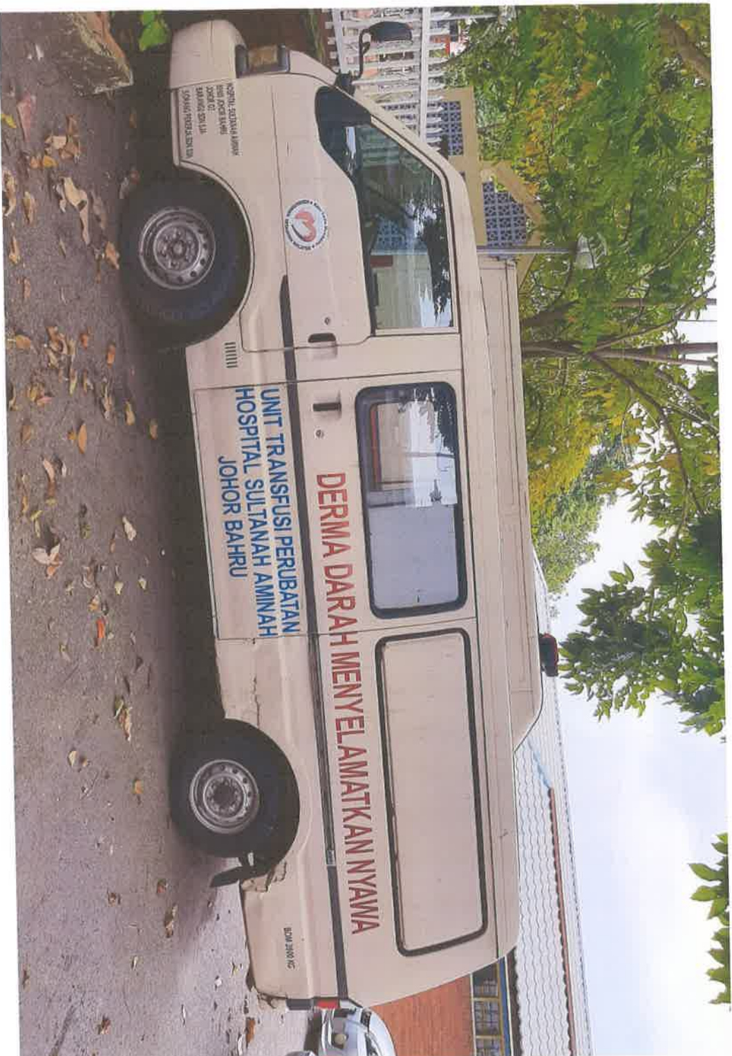
Pandangan Sisi Kiri Kenderaan