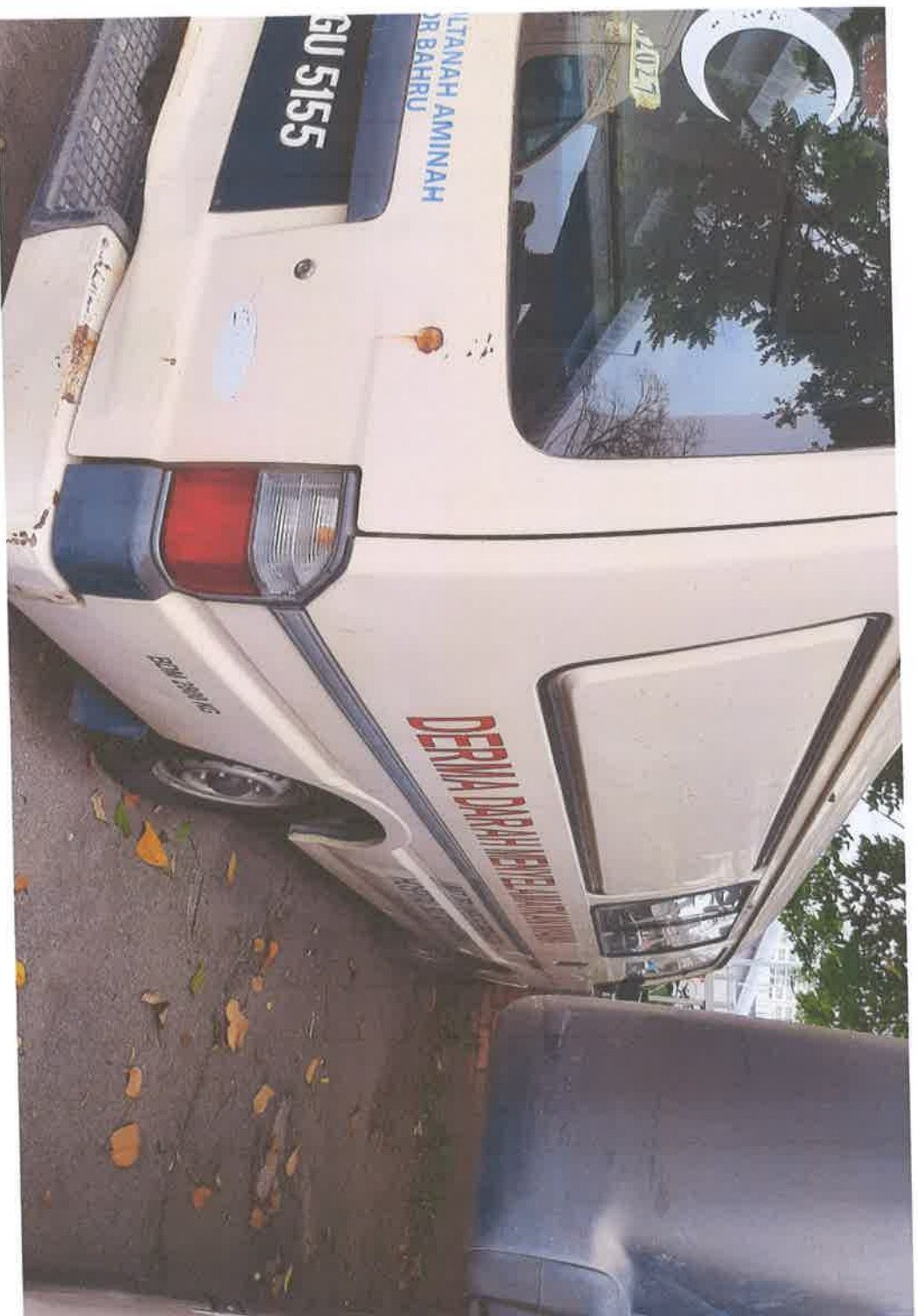
Pandangan Sisi Kanan Kendaraan