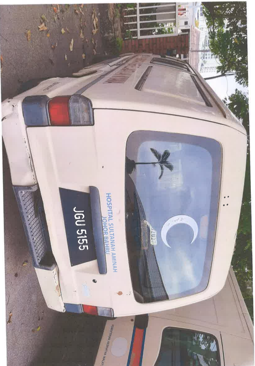
Pandangan Belakang Kenderaan