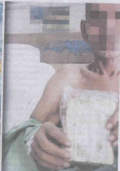
Gambar roti berkulat dihidangkan HKL yang tular di media sosial pada Ahad lalu.