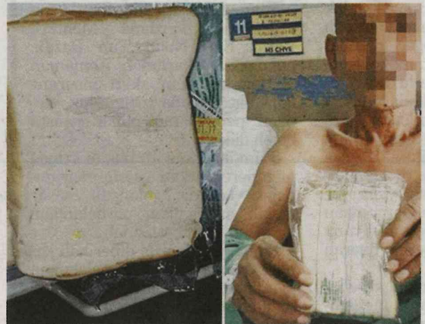
GAMBAR seorang pesakit (kanan) menunjukkan roti yang didakwa berkulat di HKL menjadi viral di Facebook baru-baru ini. Tompokan kuning pada gambar roti (kiri) sebenarnya adalah yis.

HKL menjelaskan, pihak hospital telah mengarah Jabatan Dietetik dan Sajian HKL untuk menjalankan siasatan lanjut berkenaan insiden tersebut termasuk membuat pemeriksaan bekalan roti di wad dan juga stok roti di jabatan berkenaan. - Bernama