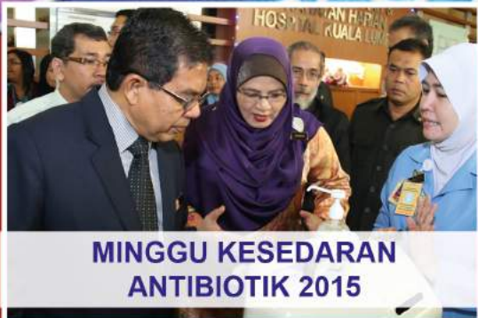
MINGGU KESEDARAN ANTIBIOTIK 2015