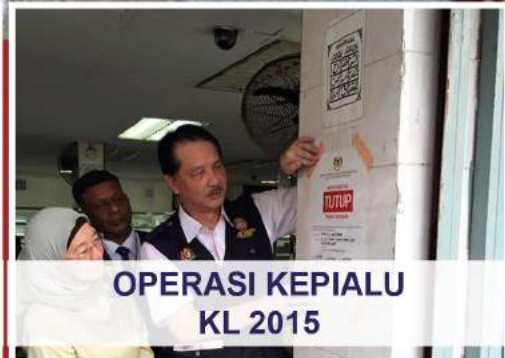
OPERASI KEPIALU KL 2015