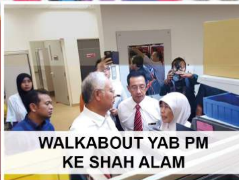
WALKABOUT YAB PM KE SHAH ALAM