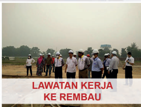
LAWATAN KERJA KE REMBAU