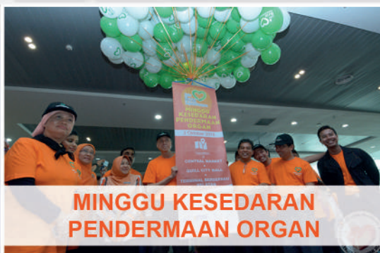
MINGGU KESEDARAN PENDERMAAN ORGAN

KEMENTERIAN KESIHATAN MALAYSIA SEMPENA HARI SUKAN NEGARA