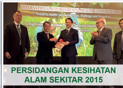
PERSIDANGAN KESIHATAN ALAM SEKITAR 2015