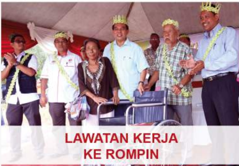
LAWATAN KERJA KE ROMPIN