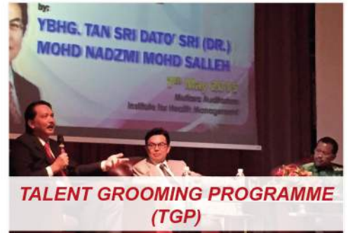
TALENT GROOMING PROGRAMME (TGP)