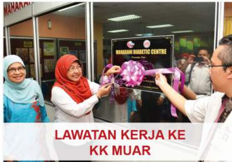
LAWATAN KERJA KE KK MUAR