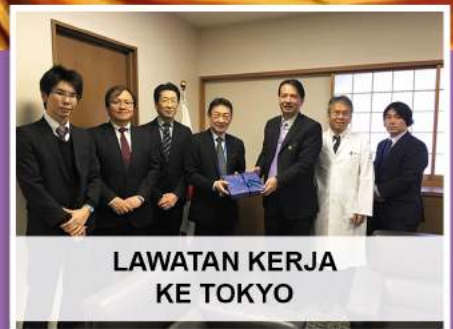
LAWATAN KERJA KE TOKYO