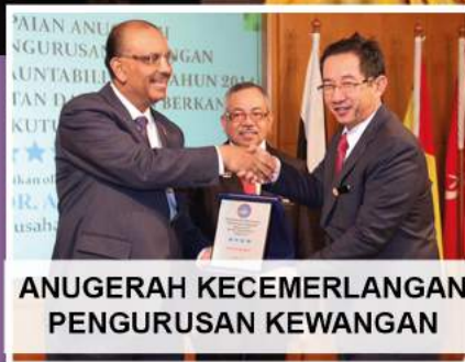
ANUGERAH KECEMERLANGAN PENGURUSAN KEWANGAN