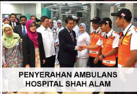
PENYERAHAN AMBULANS HOSPITAL SHAH ALAM