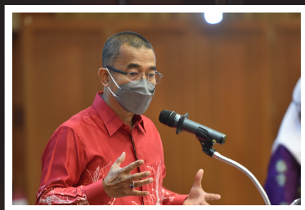
PROGRAM IMUNISASI COVID-19 KEBANGSAAN KANAK-KANAK (PICKIDS)