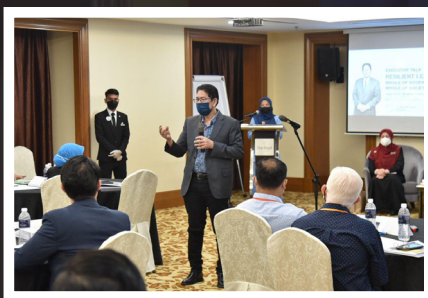
TALENT DEVELOPMENT PROGRAMME (TDP) PERTINGKAT KUALITI KEPIMPINAN