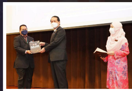
MAJLIS PELANTIKAN KETUA & TIMBALAN PROFESION KESIHATAN BERSEKUTU