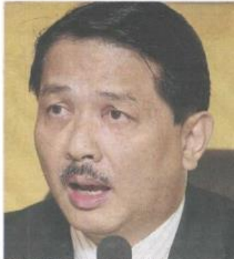
Datuk Dr Noor Hisham Abdullah says the Health Ministry will launch the 'Let's Quash Aedes' campaign this month

Dr Noor Hisham said until Sept last year, 2,668 Combi projects had been launched, involving 53,360 volunteers nationwide.