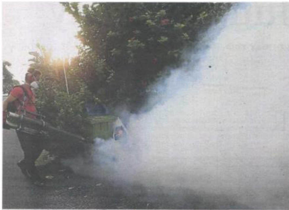
Fogging operations and spraying of insecticide in the city's drainage system will be carried out to combat the Aedes menace. File pic