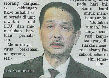
DR Noor Hisham

"Duduk di rumah," katanya menerusi kenyataan yang disiarkan menerusi akaun Facebook beliau di sini, semalam.