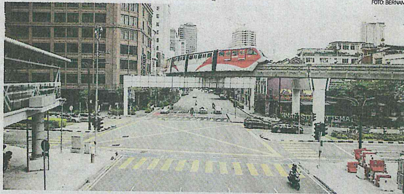
Suasana lengang di ibu kota Kuala Lumpur berbanding hari biasa susulan penguatkuasaan Perintah Kawalan Pergerakan yang memasuki hari ketiga semalam.

"Tetapi jika mereka tidak boleh melaksanakan tanggungjawab tersebut, mungkin kita terpaksa isytiharkan darurat seperti yang dilaksanakan di negara China dan ini mungkin tidak digemari oleh masyarakat," kata beliau dalam wawancara eks-