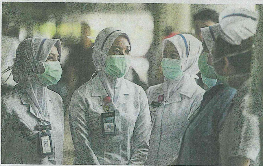
KERAJAAN bersedia memanggil semula doktor perubatan yang sudah bersara atau pegawai perubatan yang berkhidmat dalam angkatan tentera sekiranya berlaku peningkatan mendadak kes Covid-19 di negara ini.