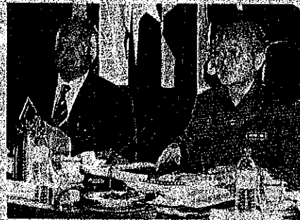
Abdullah mempengerusikan Mesyuarat Majlis Tertinggi UMNO pada 25 Ogos 2005. Turut serta, Datuk Seri Najib Tun Razak (kiri).

Sebelum ini, Astro Awani melaporkan tubuh badan Pak Lah yang berusia 82 tahun itu tidak