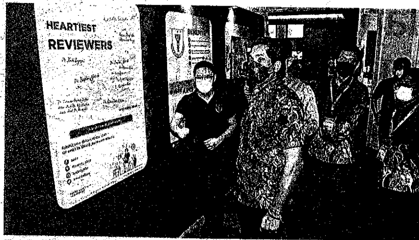
Khairy melawat pameran selepas Majlis Pelancaran Panduan Amalan Klinikal Pengurusan Demensia (Edisi Ketiga) dan Pengurusan Schizophrenia (Edisi Kedua) di Kuala Lumpur, semalam.