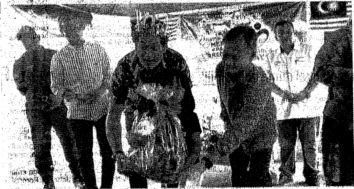
Khairy ketika menyampaikan hadiah kepada pemenang pada Program Merdeka@Parlimen Rembau pada Ahad.

Menurut beliau, 53 peratus rakyat Malaysia tidak menyaring kesihatan sejak setahun lalu.