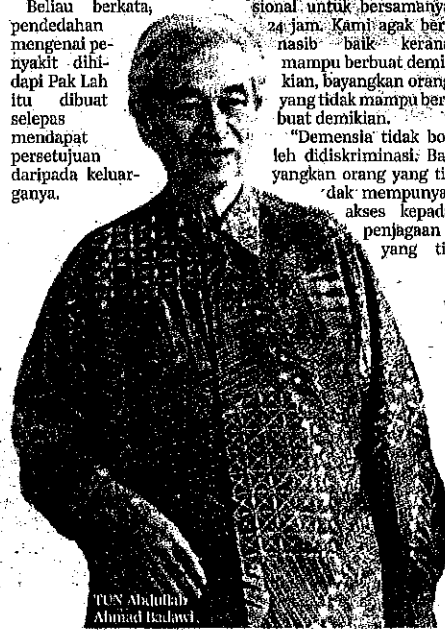
TUN Abdullah Ahmad Badawi

"Saya rasa ini adalah masalahnya bahawa kita memerlukan kertas putih penjagaan kesihatan bagi menyediakan komuniti yang lebih baik, termasuk akses lebih untuk pesakit mental," katanya.