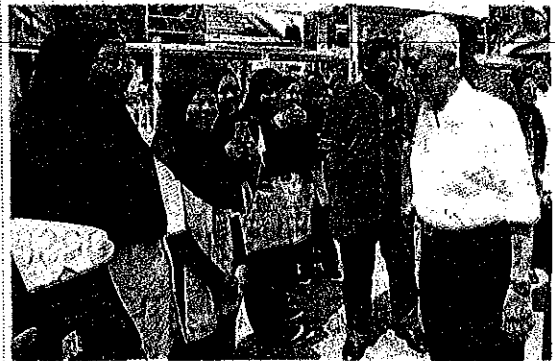
Former prime minister Tun Abdullah Ahmad Badawi (right) speaking to students at the launch of the TRG Edu Centre in Politeknik Ungku Omar, Ipoh, on Feb 20, 2018.

"They still want them around and there is nothing wrong with that. In this HWP, going forward, we will fight for better commu-